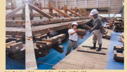
解体修理中の唐招提寺金堂

木造建築はきちんと修理すれば千年以上もちます。奈良県庁には文化財修理専門の建築家と大工さんが所属して、文化財を未来に伝えるために修理現場で働いています。 ときには建物をばらばらにしてまた元どおり組み立てる「解体修理」も行われます。