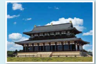
主な文化財(特別史跡) 平城宮跡

平城宮は、天皇が暮らし、政治を行い、役人が働くところで、平城京の北のはしにありました。たくさんの建物跡や生活道具が地下に残っていて、少しずつ発掘調査が行われています。