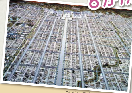
平城京のようす(模型)