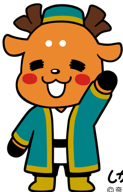
しかまるくん

中央アジアに位置し、サマルカンドやブハラなど、シルクロードの要所として知られる歴史ある国です。第2の都市サマルカンドは、幾何学模様の青いタイルを用いたイスラム建築と青空が美しく調和し、その景観から「青の都サマルカンド」と呼ばれています。