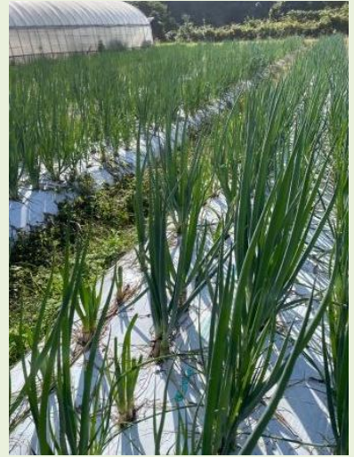
取材に伺った令和7年は10月になっても残暑が続いており、まだ白いマルチシートが使用されていました

夏の定植時には白いマルチシートを使用して夏の土壌の温度上昇を抑え、逆に冬季は黒のシートを使用して土壌の凍結を防いでいます。