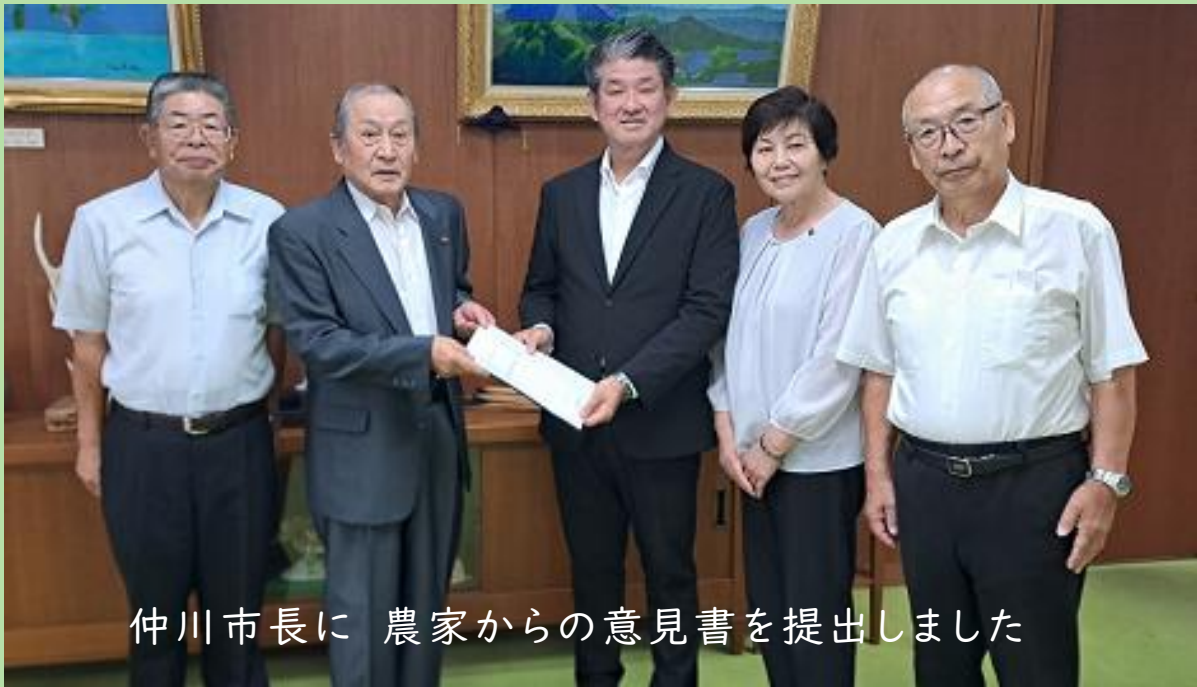
仲川市長に 農家からの意見書を提出しました