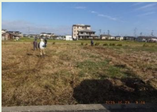
10月の草刈りの様子