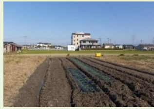
11月耕起し、玉ねぎの苗を定植