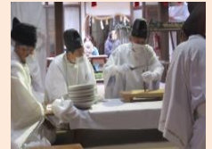
※写真は登彌神社HPより