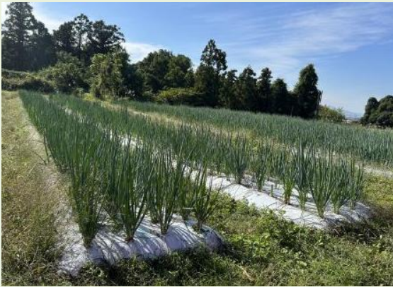
3度目の収穫を待っている状態の青ネギ。3方を山に囲まれた農園です。

刈り取り時には、都度施肥をして品質管理されているため瑞々しく甘い青ネギが育っています。 育苗も、自身でされており、播種時は播種板を使用して苗を作り、一反に播種板約50枚、60枚分の苗を手作業で定植します。一人での作業はさすがに重労働となりますが、繁忙期には奥様のサポートもあって、1ヘクタールのネギ畑を維持し、安定した収量を確保することができているそうです。