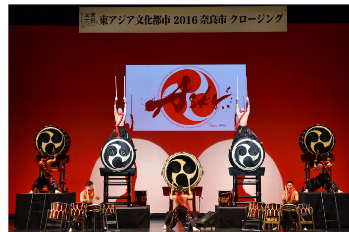
奈良市:舞太鼓あすか組「WASSHOI/RAN」