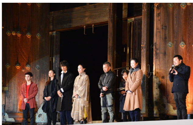
あいさつする監督と出演者