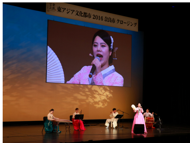
済州特別自治道:ヤンジウン・韓国国楽協会済州支部「済州民謡メドレー/韓国フュージョン国楽」