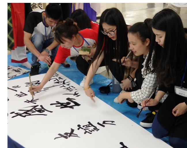
3か国の学生が協力して寄せ書きを作成

「日中韓共通文化『漢字』から読み取るそれぞれの文化」をテーマに、3か国の共通漢字をまとめた「日中韓共同常用八百漢字表」から学生たちが好きな一文字を選んで書いた作品や、東アジアの共通文化である木簡を使った作品など、各国の文化を体現した書作品を制作しました。そして、作品を「日中韓大学生の書展」として5月26日から29日まで奈良県文化会館展示室で展示しました。