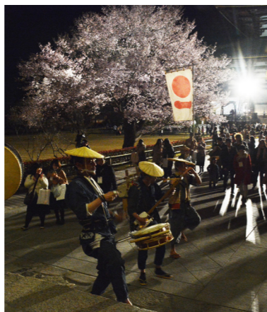
「奈良一番」による賑やかな退場時演出