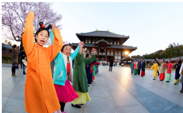
シンポジウムから式典へ子どもたちのお出迎え