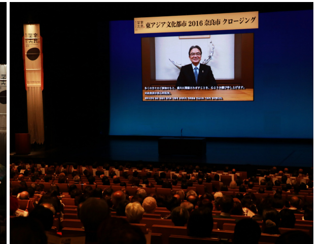
宮田亮平文化庁長官ビデオメッセージ