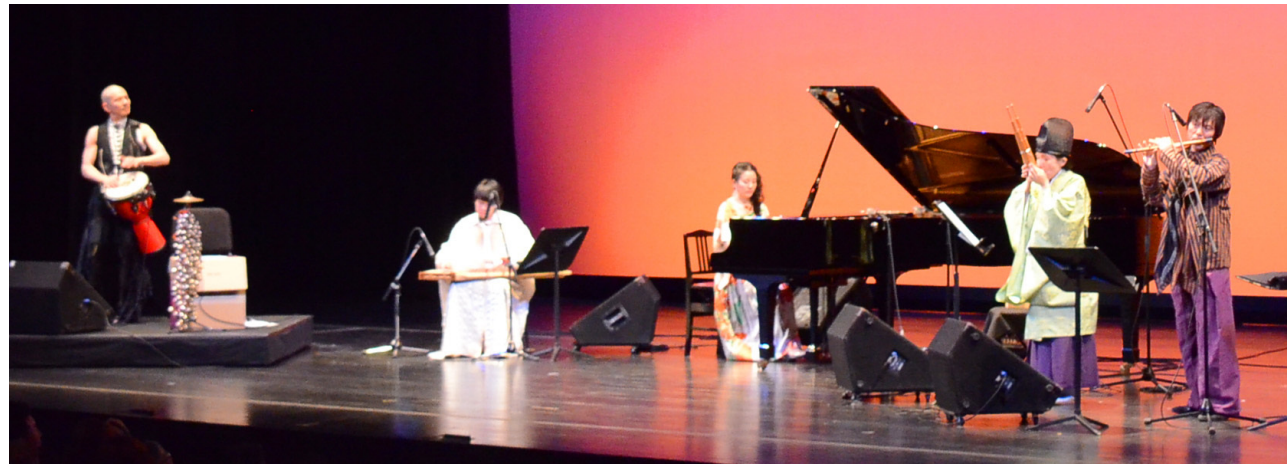
奈良市:奈良楽譜[Silk Road Mix Trip]