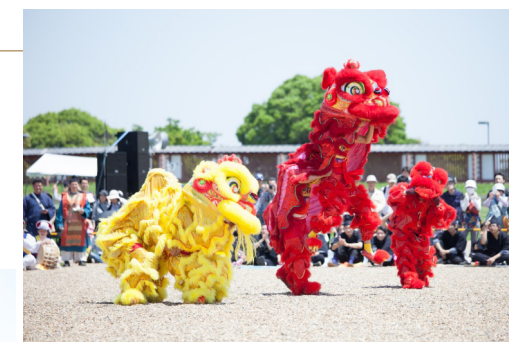
寧波市 梅山獅子舞

春の平城京天平祭は「東アジア」がテーマで、寧波市・濟州特別自治道の伝統芸能が会場を大いに盛り上げました。また、食部門「Nara Food Caravan」がモンゴル遊牧民の伝統的住居「ゲル」を出店し、シルクロードの味を楽しめる料理を提供しました。