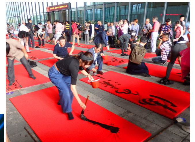
地面書道芸術交流展