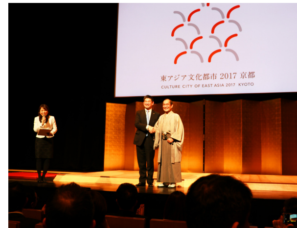
次期開催都市・京都市へのバトンタッチ