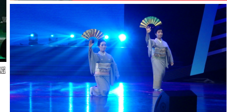
「藤間流みやび会」による舞踊