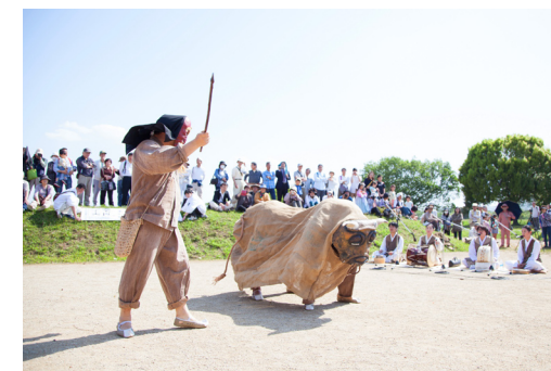
濟州特別自治道 伝統仮面踊