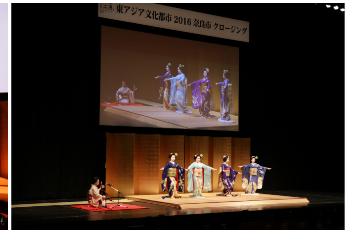
京都市:東アジア文化都市2017京都交流大使 京の舞妓「祇園小唄」