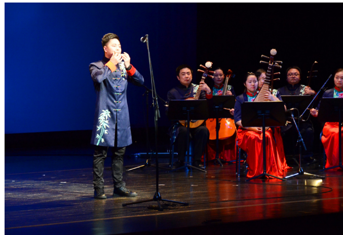
寧波市:寧波市演芸集団 演奏「河姆渡発想」/独舞「水墨天一」