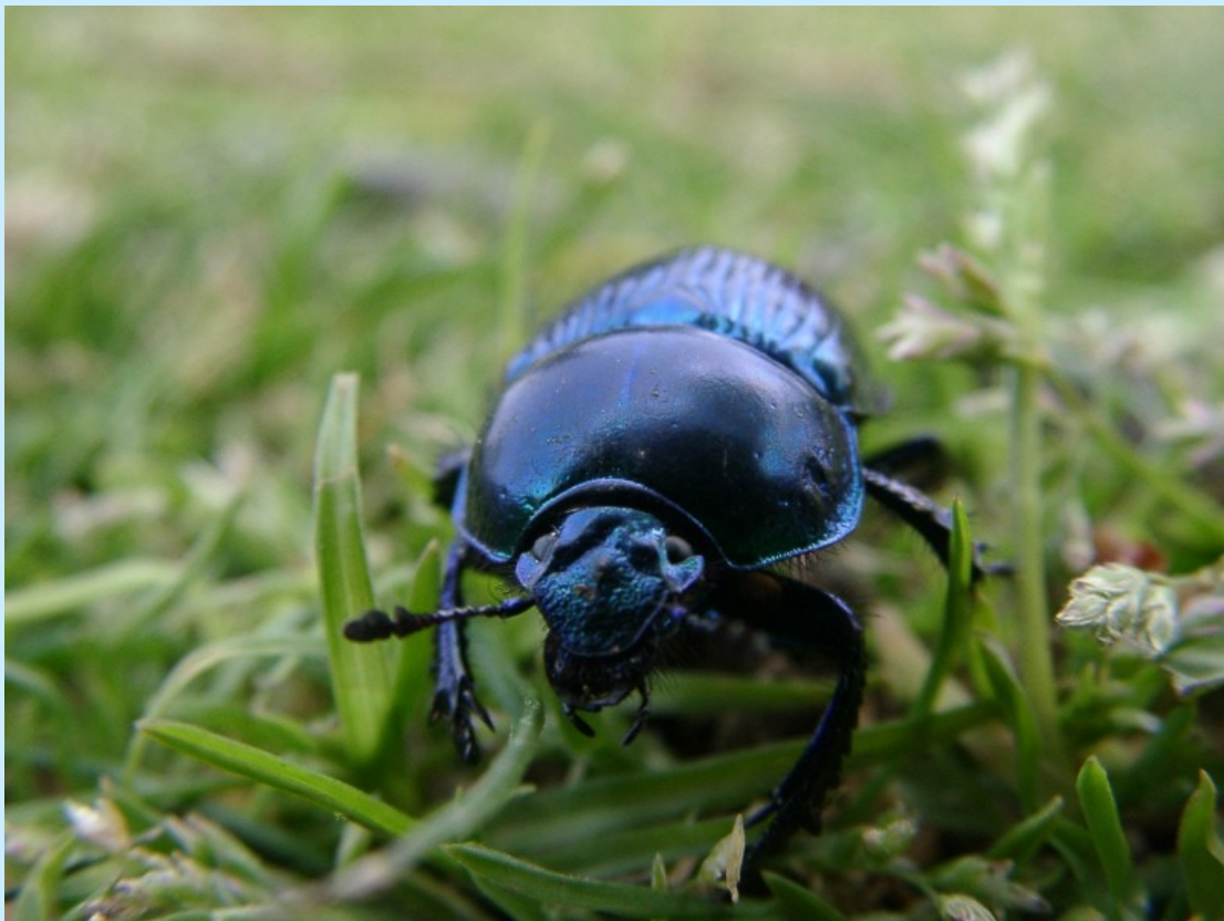
ルリセンチコガネ (オオセンチコガネ (ルリ型))