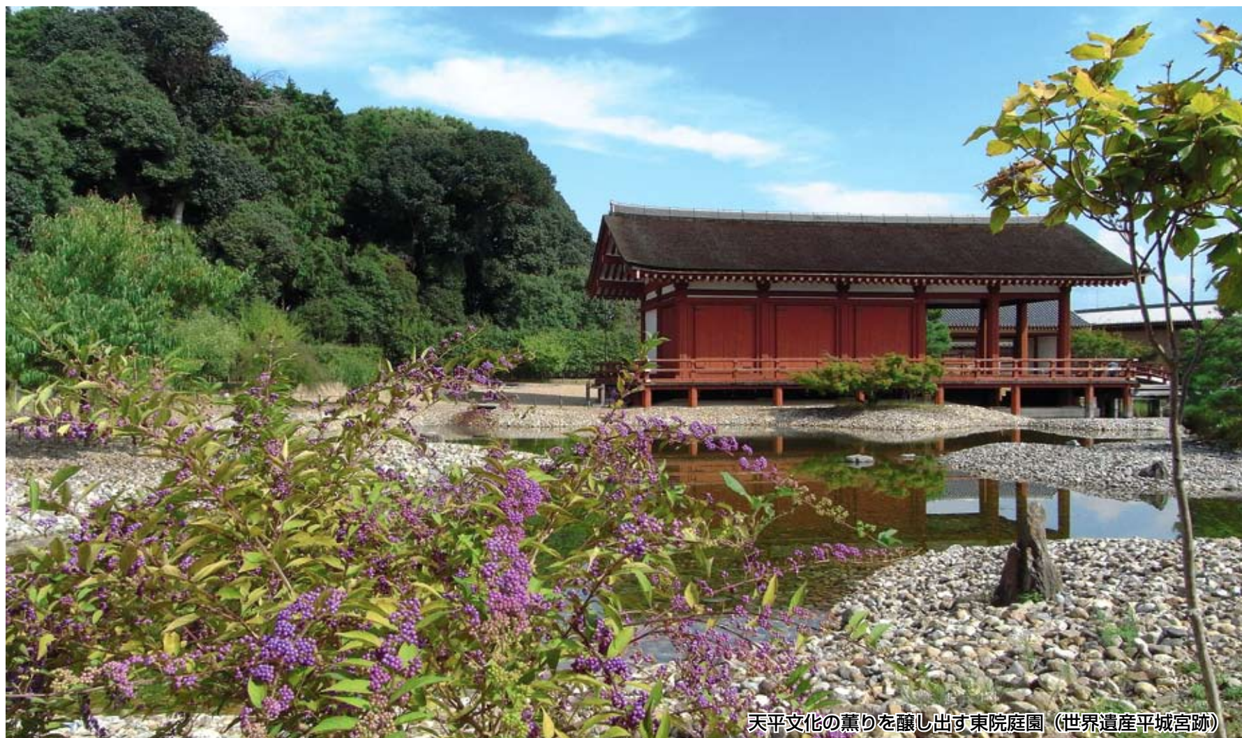
天平文化の薫りを醸し出す東院庭園（世界遺産平城宮跡）