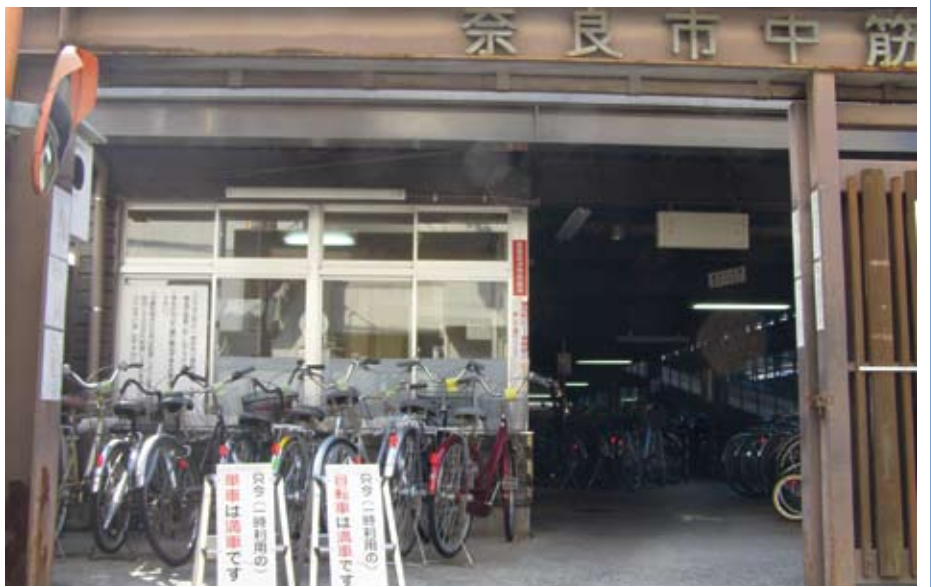
また満車！近鉄奈良駅周辺の自転車駐車場（中筋町）

答 現在、駅周辺に収容台数600台の市営自転車駐車場、収容台数1670台と500台の民間自転車駐車場がある