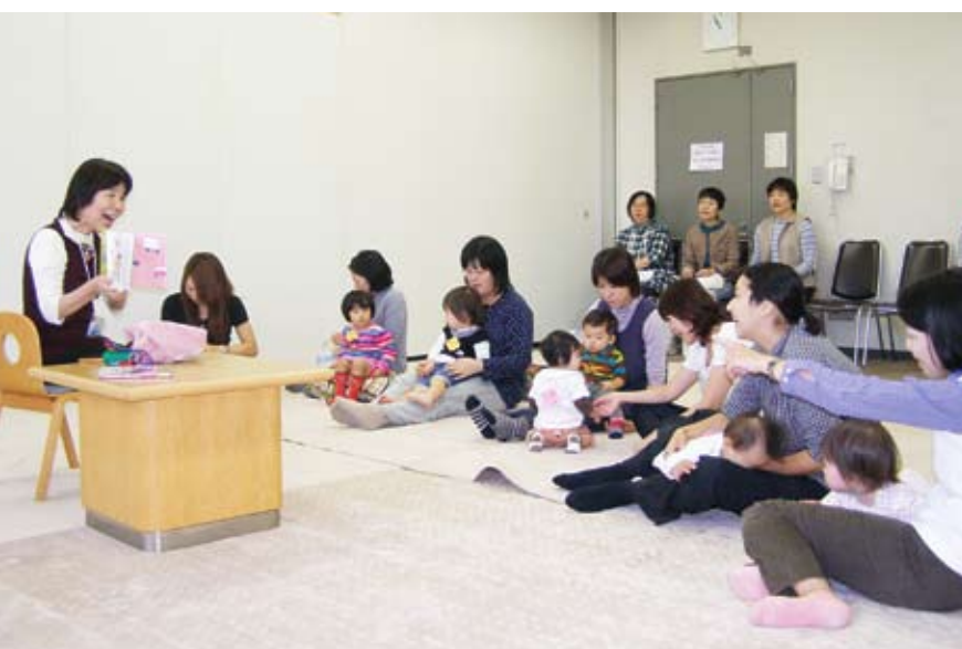
絵本の読み聞かせ 楽しいふれあいの時間 (市中央図書館)

答 主な取り組みとして、児童書の充実、乳幼児とその保護者に対して絵本の読み聞かせ等を行う「ふれあいを絵本