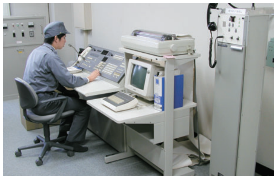
現在のアナログ式防災行政無線設備(市役所本庁舎内)

建設費用は病院事業債で対応し、元利償還金の22・5%は交付税措置がある。運営面でも、学生一人当たり年額60万円余りの交付税措置がある。