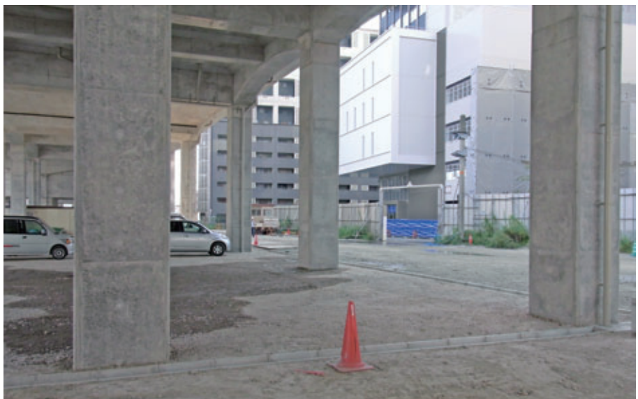
公共施設用駐車場として検討中のJR奈良駅南側高架下

問 平成22年3月にJR桜井線の高架運行が開始され、JR奈良駅の鉄道高架はすべて完成した。高架下の利用計画