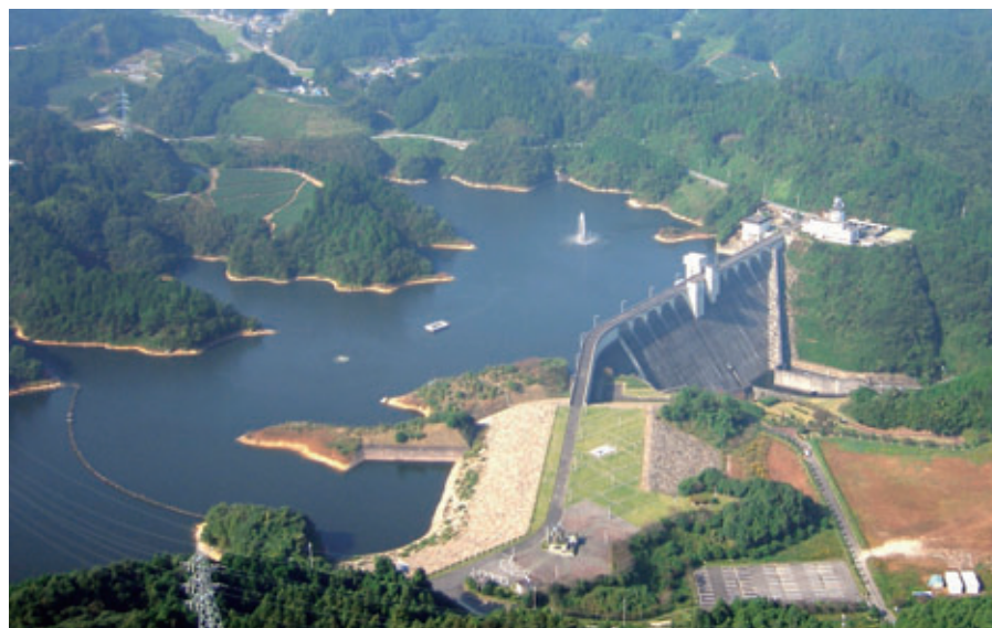
割賦負担金を償還中の布目ダム