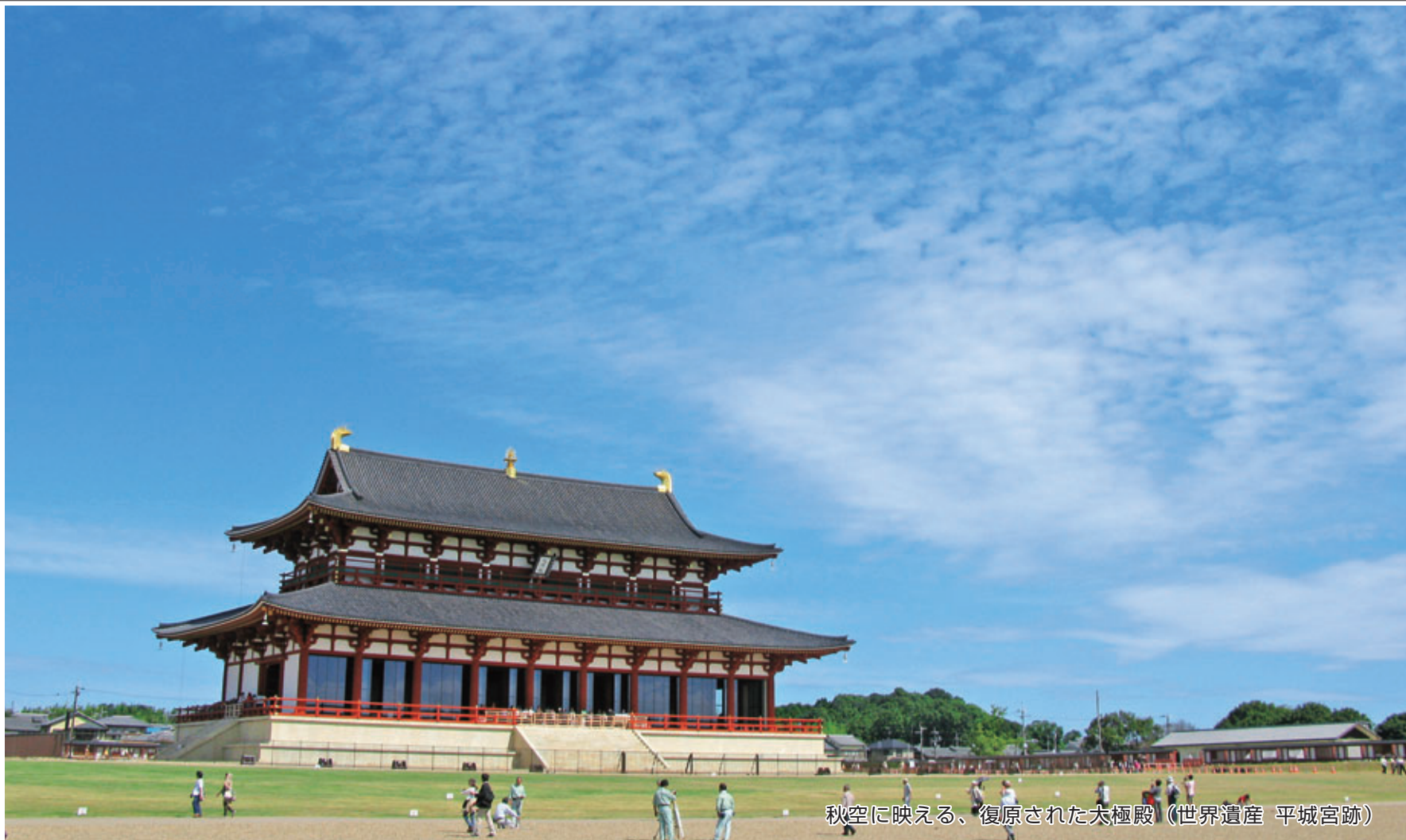
秋空に映える、復原された大極殿(世界遺産 平城宮跡)