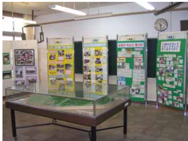
隣の部屋は、右京博物館