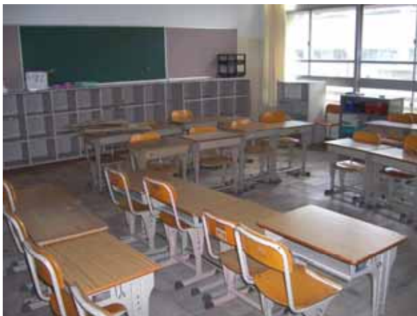
利用予定の部屋の様子