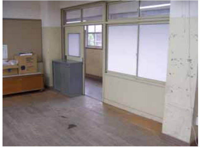
利用予定の部屋の様子