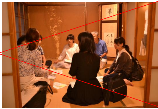
会場イメージ:奈良女子大学セミナーハウス(ならまち)