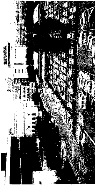
増築予定地の現庁舎裏駐車場

問 人口増加に伴う職員増加で、現在の庁舎北側に、地下一階、地上六階の庁舎を三年計画で増築するため、今年度予算で七億二千万円が計上されたが、当初の計画通りで変更はないのか。 答 当初の計画は、設計段階で構造上問題があるため、本館の西寄りから増築部分に渡っていきるようにし、延べ面積も当初より広くして九千二百平方メートルにした。また増築によって狭くなる駐車場は、二階建ての立体駐車場としたい。