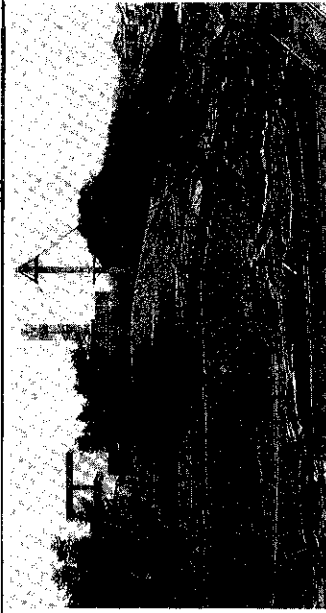
完成が待たれる「野鳥の森」

については、専門家の意見を聞きながら研究している。なお、鳥は、オーストラリアから珍鳥が贈られる話もある。