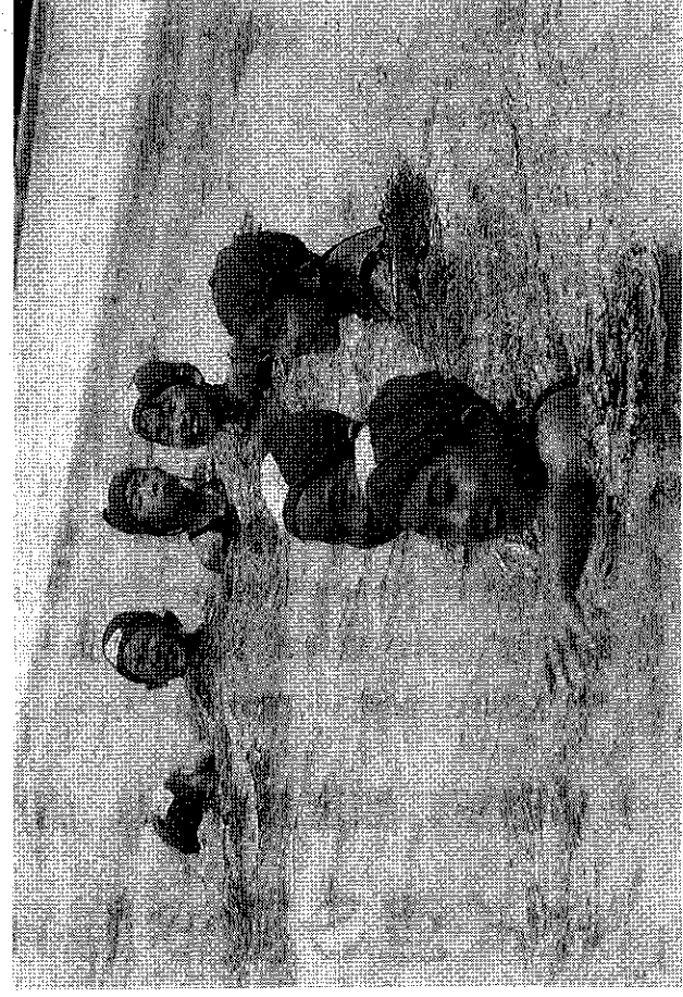
水の中での元々いっばい小学生

初日には市長から招集あいさつがあり、この中で市長は、昨年十一月二十二日に爆発火災事故が発生した粗大ごみ処理施設について、「事故再発防止に万全の措置を講じてまいりたいが、爆発物や引火性のものが混入されますと事故再発の危険があるので、ごみの分別収集の徹底と危険物を