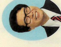
松石 聖一 議会運営特別委員長 社会民主党市議団幹事長