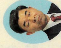
船越 義治 議会運営特別委員長 都市基盤整備特別委員会 (公明)