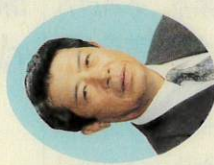
嶋 宏明 議会運営特別委員長 都市基盤整備特別委員会 (交政)