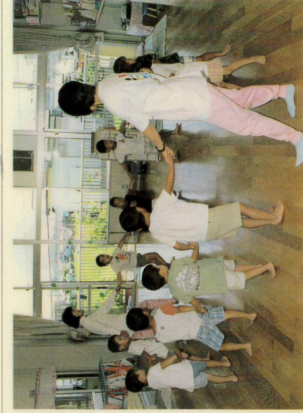
みんななつっしょ、楽しい保育園

問 保育所待機児童の解消に国は定員の弾力化を進め、年度当初は、プラス一〇%、年度途中はおおむねプラス一五%、最高二〇%までの入所を認めている。国の方針にどう対応するか。児童福祉施設最低基準、特に保育所設備基準が守られるのか心配だ。 答 国の入所円滑化対策に従い、待機児童の多い保育所では、施設の最低基準、保育所の配置基準を考慮し、認可定