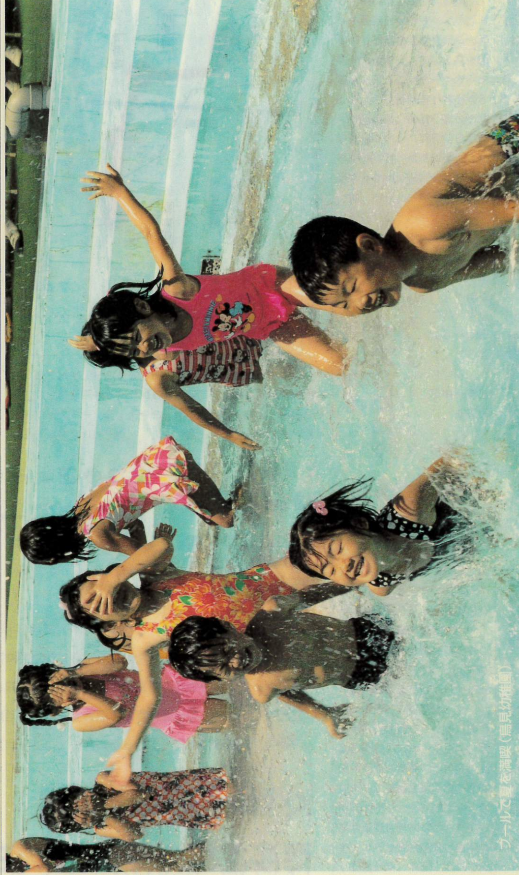
プールで夏を満喫(鳥見幼稚園)

〒630-8580 奈良市二条大路南1-1-1 奈良市議会議務局 ☎(0742)34-4734