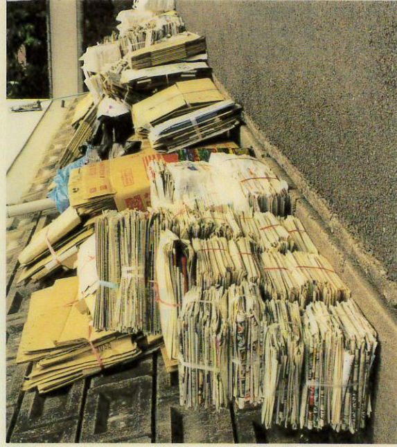
古新聞、雑誌の集団資源回収

問 自治会が積極的に取り組み、ごみの減量化に寄与してきた新聞・雑誌などの集団資源回収で、最近、雑誌は費用を出さないと回収業者が引き取ってくれない事態が起こり、将来に向けて集団資源回収が成り立たなくなる心配が