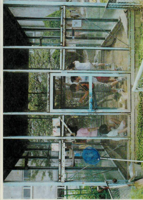
小動物の世話をする子どもたち（雷雄南小学校）

を通して動物の持つあたたかさや、命の大切さを肌で感じたり、級友と一緒に動物の世話をすることから協力や責任感等を学ぶ良い機会である。また、教職員が専門家の協力を得て具体的に学ぶなど、動物飼育についての基礎知識を持つことが大切であると考