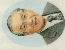
大谷所 委員長 (無所属)