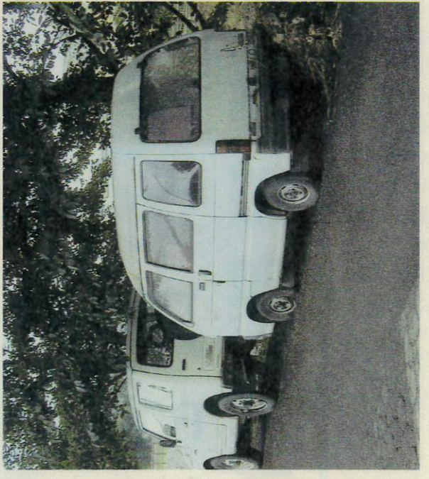
迅速な撤去が待たれられる放置自動車(三条川西町)

問 マンションの受水槽へのメーターの取り替えは水道局負担だが、各戸へのメーターは住民負担となっている。条例では、水道メーターは市水道局が無償で貸与となっている。無償で取り替えるべきでは。 答 水道法及び市水道給水