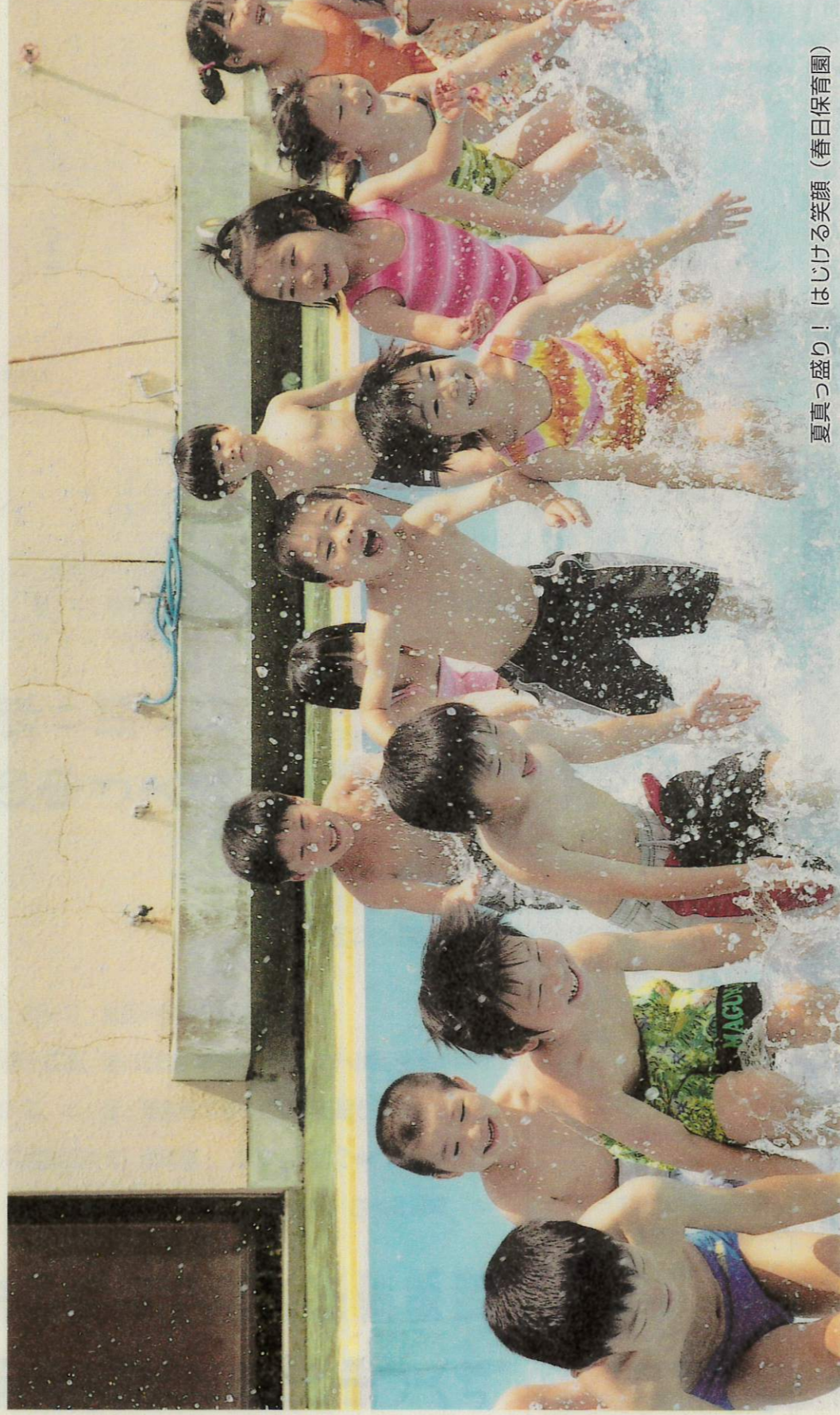
夏真っ盛り! はじげる笑顔 (春日保育園)

〒630-8580 奈良市二条大路南1-1-1 奈良市議会事務局 ☎(0742)34-4734