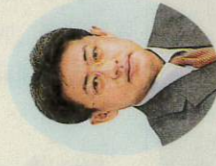
北村拓哉 副委員長 日本共産党市議会議員団)