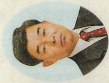
船越義治 副委員長 (公明党市議会議員団)