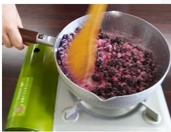
ブルーベリーと砂糖を しっかり混ぜて加熱。

今回参加されていた方の多く は奈良市中心部の方で、近くで 様々な田舎体験が出来る東部 地域には時々来るとの事でした。 奈良市東部でブルーベリー狩 り体験が楽しめる場所は、上深 川営農(都祁)、あおはに会(柚 ノ川)、田原ブルーベリー園など があります。 (松村)