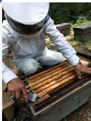
王台(女王蜂の卵)が ないか内検する様子。