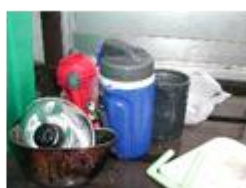
不燃物混載 (可燃ピット搬入時)