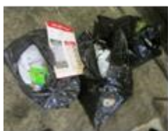
中身の見えない不透明袋 (黒・緑・青色等)