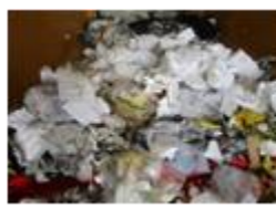
産業廃棄物 (廃プラスチック類)