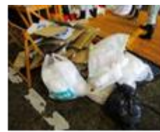
再生資源物 (段ボール等)