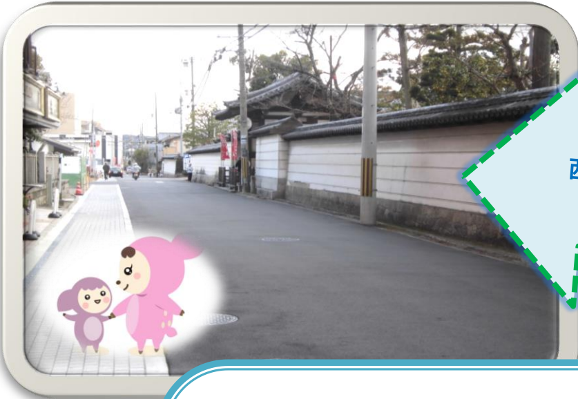
西大寺東側 道路拡幅完成