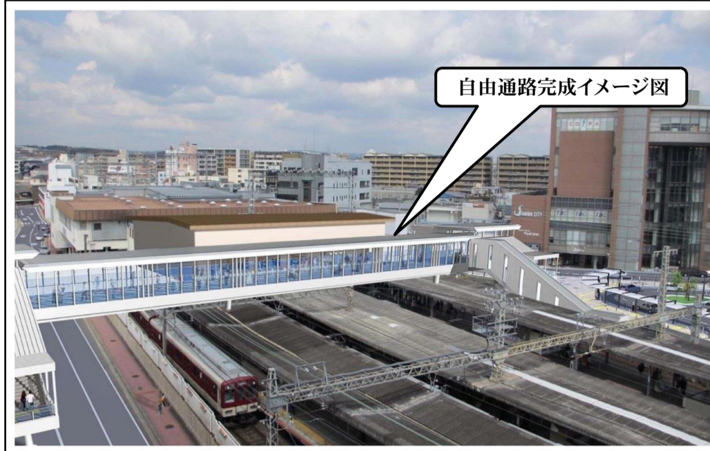
自由通路完成イメージ図

自由通路が供用開始した後は、駅北側の駅舎、改札機能が橋上駅舎へと移りますので、駅利用者は南北の駅前広場より自由通路を介して橋上駅舎へ進むことになります。