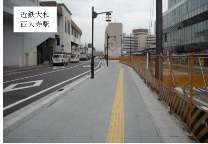
近鉄大和 西大寺駅