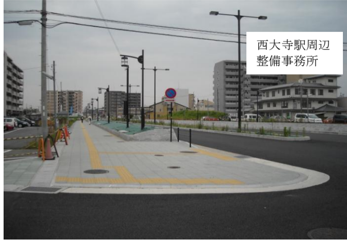
西大寺駅周辺整備事務所