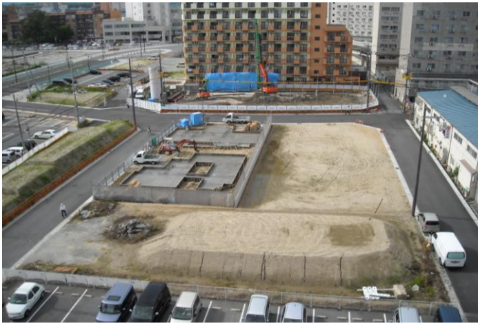
区画道路を整備した西大寺南町付近