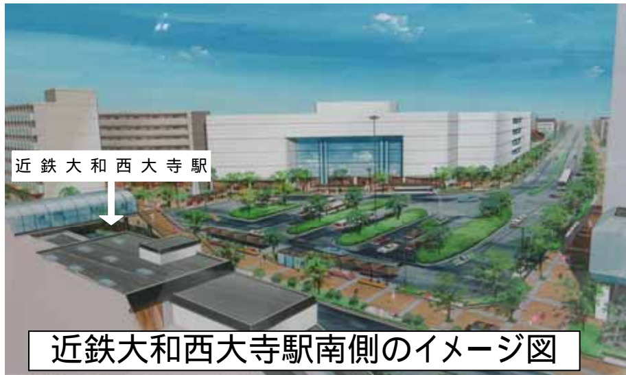
近鉄大和西大寺駅南側のイメージ図