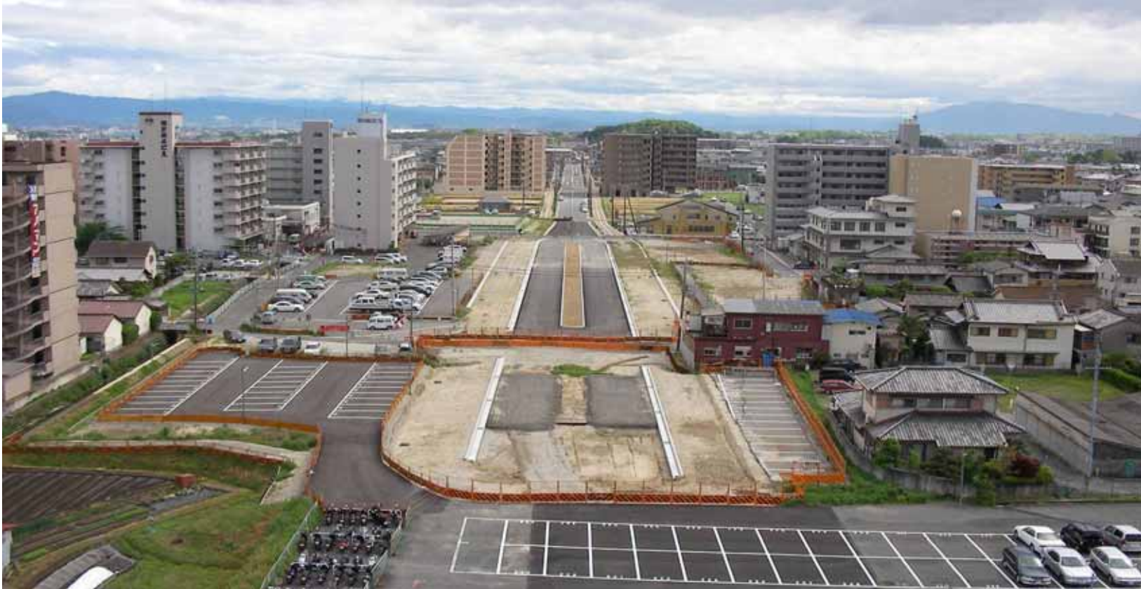
近鉄大和西大寺駅南側から西大寺阪奈線を臨む。(平成18年6月現在)