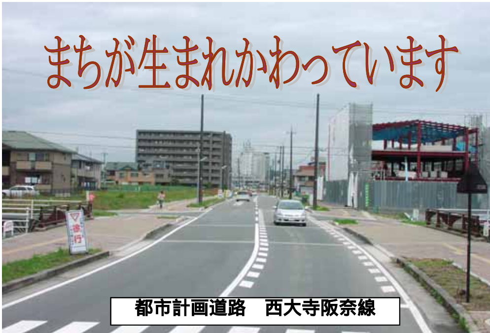
都市計画道路 西大寺阪奈線

皆様のご理解とご協力で 事業が進んでいます。 一日も早い事業の完成を めざして努力いたします。