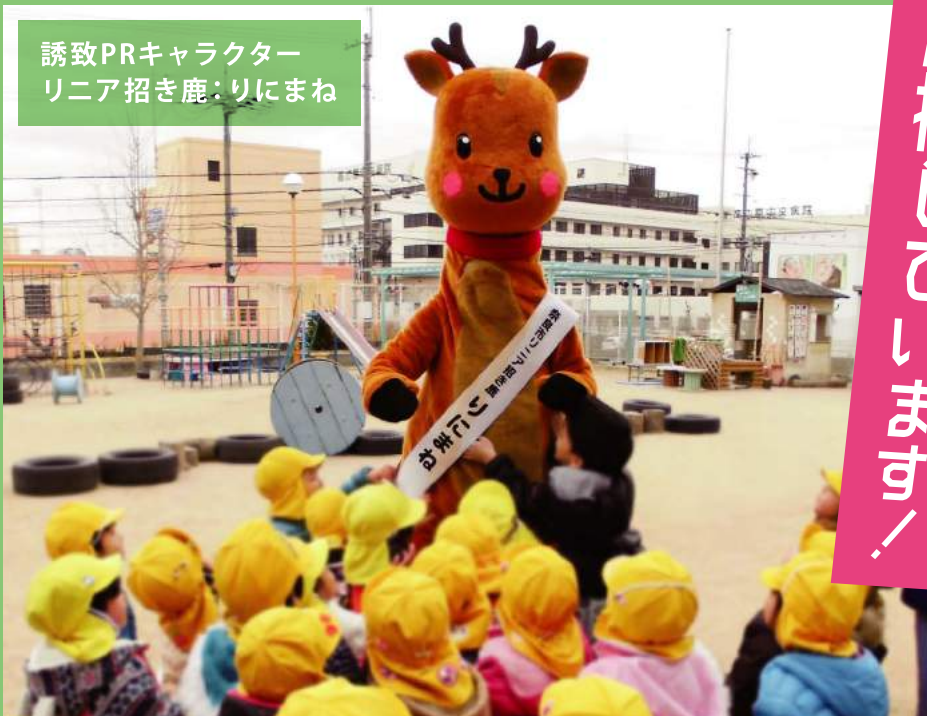
誘致PRキャラクター リニア招き鹿：りにまね