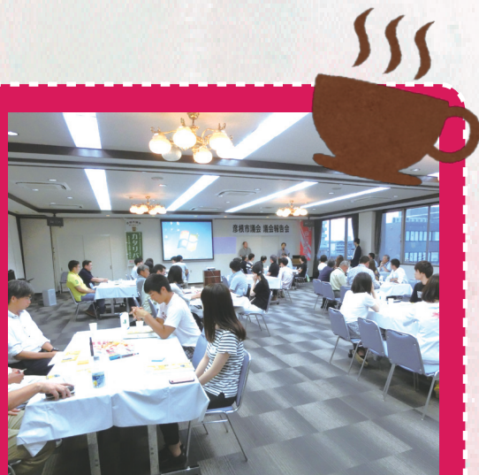
ワールドカフェの様子(彦根市議会 議会報告会)