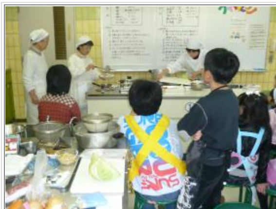
NEW環境体験講座「ポトフを作って考えよう！」

3. 学校との長期協働事業…学校の授業の一環として、長期的に環境学習をするもので、現在は菜の花プロジェクトやネイチャーゲームなどを1年を通じて実施しております。