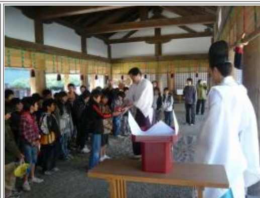
春日大社への奉納