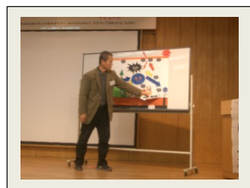
交流会「たくみかふえ」の様子