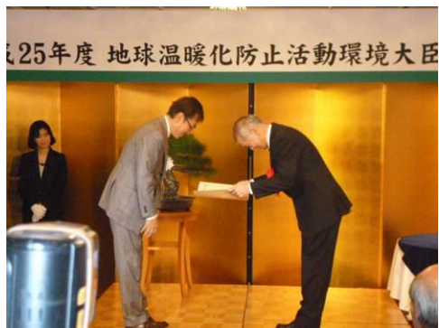
大臣より、表彰状授与