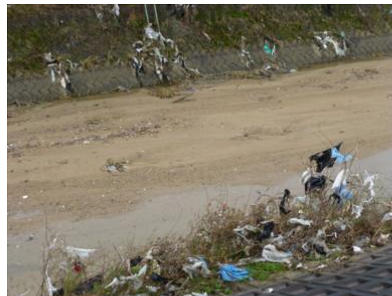
近鉄田原本線 但馬駅付近→

国がレジ袋を容器包装リサイクル法で規制することで、簡単にこのような状況をなくせるのに・・・と残念ですが、せめて奈良市が一日も早くレジ袋有料化協定を事業者と締結できることを願っています。（栗岡理子）