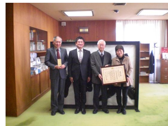
表彰を受けたことを市長に報告