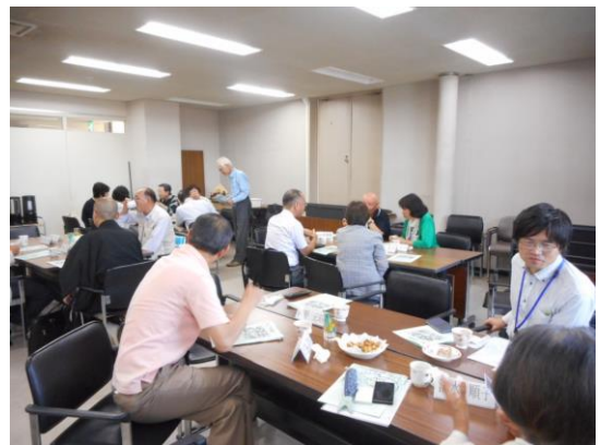
3つのテーブルに分かれて意見交換などで親睦を深めました。