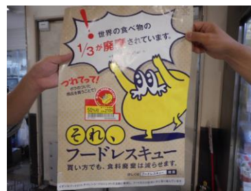
店頭で回収された資源（缶、ペットボトル、エコキャップなど。）で子どもたちが作成した壁新聞 お刺身などの生鮮品に掲示。廃棄する食品を減らしたい

食品ロス・廃棄問題の解決を目指す「フードロス・チャレンジ・プロジェクト」では、「つれてって！それ、フードレスキュー」の看板を見せていただきました。掲示して、なるべく買っていただくようにして廃棄を減らそうとしている取り組みです。