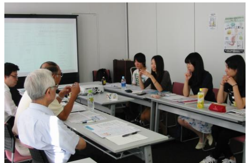
意見交換会の様子の写真

いますが、その取材・執筆や編集も学生さんたちの活動になっています。現在3号発行の準備を進めています。ご希望の方は、NEW事務局（奈良市環境政策課）までご連絡ください。