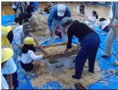
脱穀(鼓阪北小学校・幼稚園)