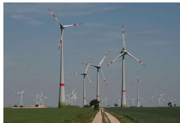
ドイツ・プレッチ村の発電用風車群