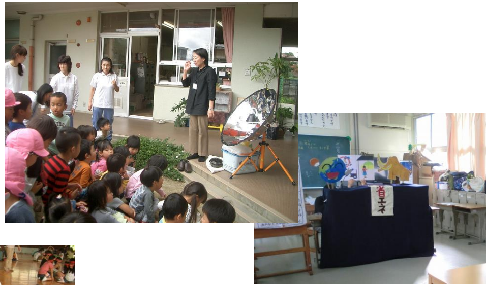
『環境ペーパーアートとソーラークッカー』 大安寺西幼稚園、鼓阪幼稚園、鶴舞幼稚園、京西保育園、 興東バンビーホーム、田原バンビーホーム