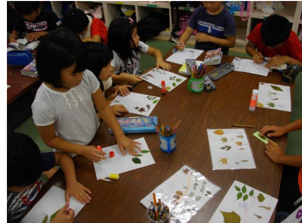
『木エクラフト』 辰市バンビーホーム、鼓阪北バンビーホーム、 富雄南バンビーホーム、都跡バンビーホーム 六条バンビーホーム