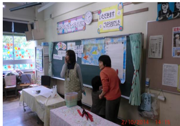
『フードマイレージゲーム（食から考える）』 伏見小学校