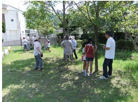
『ネイチャーゲーム（温暖化編、環境学習編）』 田原幼稚園、二名幼稚園、興東バンビーホーム、 鳥見バンビーホーム