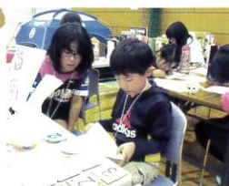
2018年12月に開催した子ども奈良CITYの様子

「子どもの参画ネットワーク奈良」は、子どもが一人の市民として尊重され、自信に満ちた社会への一員として成長すること、そして、誰もが幸せに豊かに暮らせるまちに向けて、子どもとおとなが対等な関係で、協働して未来の社会、未来の奈良を創っていくことを目指しています。2018年12月に開催した「子ども奈良CITY」では、子ども×若者たちが「まち」をつくりあげる「子ども会議」を2018年7月からスタートし、企画実現までのサポートを行いました。