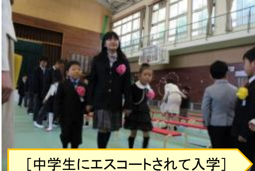
[中学生にエスコートされて入学]