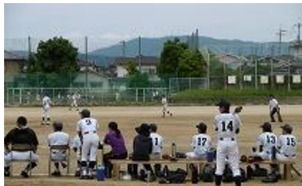
小学校の先生が応援する部活動