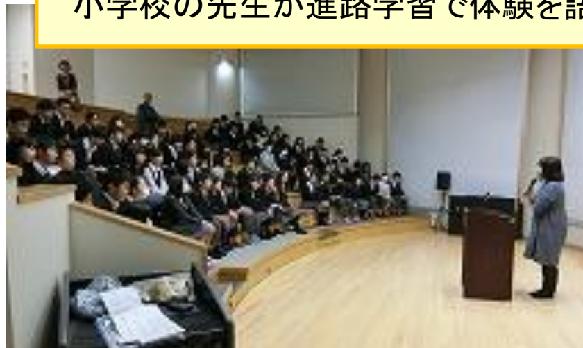
小学校の先生が進路学習で体験を語り、受験生を激励