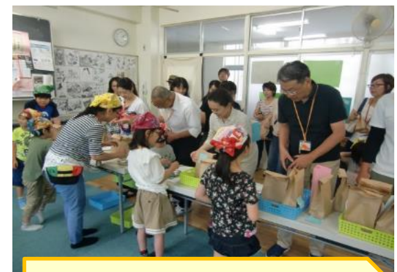
[特別支援学級の活動]