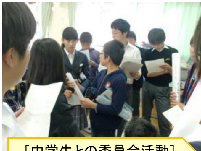
[中学生との委員会活動]