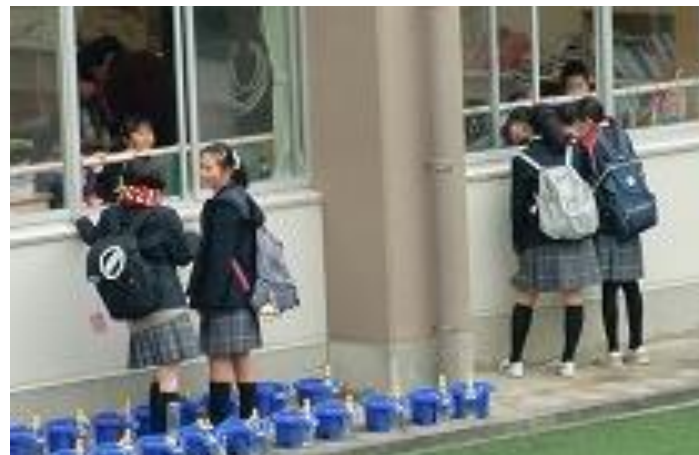
[下校の時に1年生とおしゃべりを]