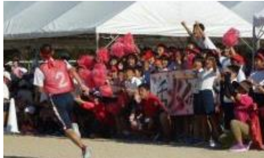
[運動会での迫力ある中学生の姿]