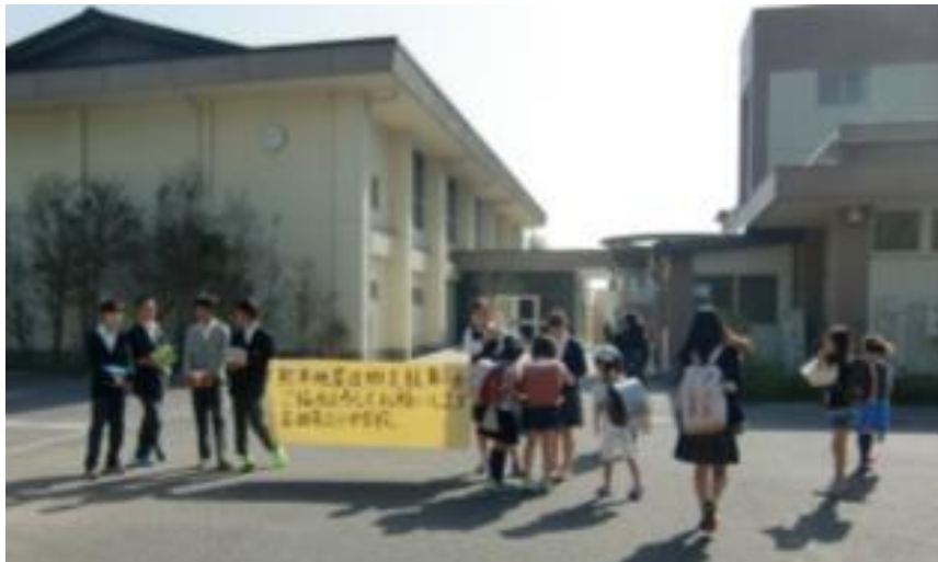
[正門で募金を呼び掛ける生徒会]