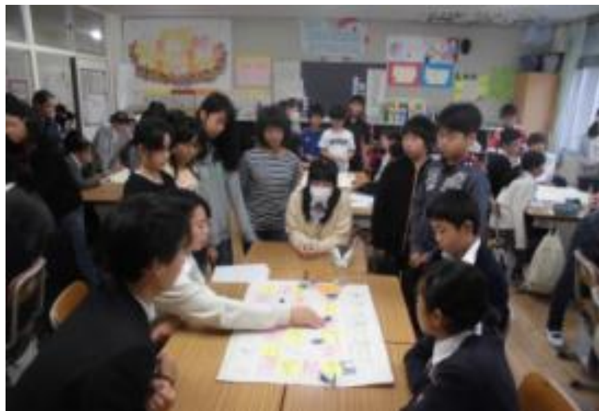
調べたことを中学生に説明(社会科)