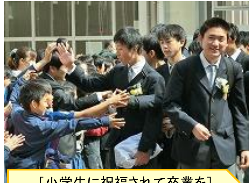
[小学生に祝福されて卒業を]