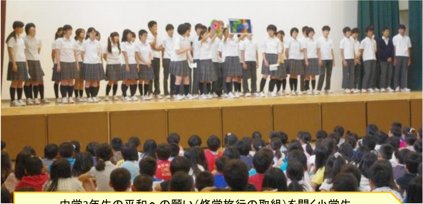
中学3年生の平和への願い(修学旅行の取組)を聞く小学生