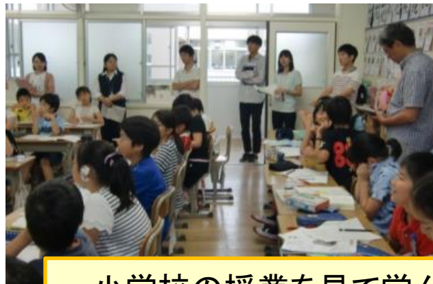
小学校の授業を見て学んだことを授業に生かす