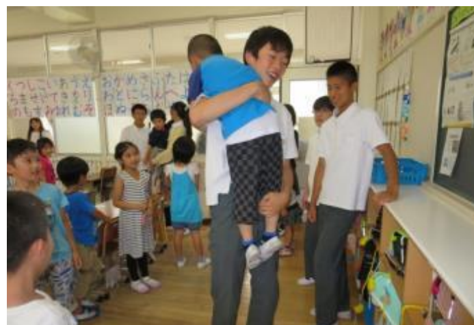
[交流清掃後の一コマ]