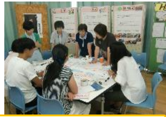
[地域も交えた合同研修]