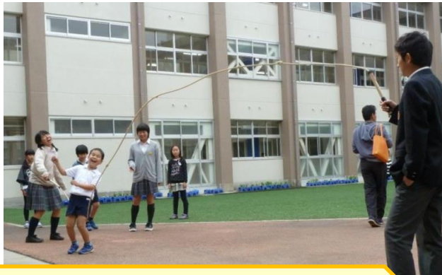
[昼休みの交流活動]