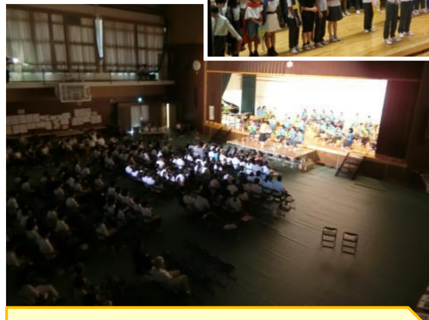
中学校の文化祭を見て刺激を受ける