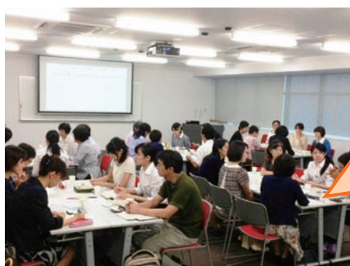
グループトークの様子

グループトークでは「私の仕事・活動での食育活動について」をテーマに、それぞれの活動について自由に情報交換を行いました。