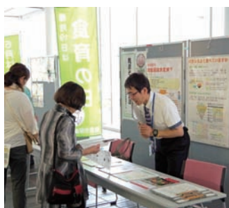
近畿農政局奈良地域センター 「見直そう!食生活」

大学生ボランティアのブースでは、大学生が子どもに食育絵本の読み聞かせをしたり、フードサンプルを使った食育クイズをしたり、親子で野菜の折り紙に挑戦したりなどして楽しまれていました。