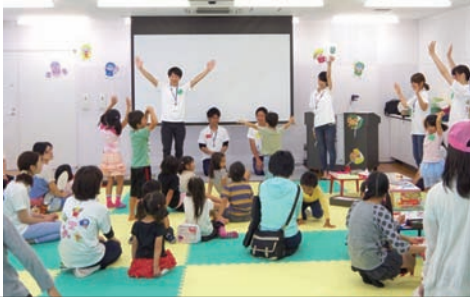
近畿大学食品栄養学科研究室 「絵本読み聞かせ、食育折り紙とうちわづくり、 大和野菜の展示」

平成27年6月7日(日)、はぐくみセンターにおいて食育実践団体が市民を対象に食育活動を行いました。7つの食育実践団体が参加し、市民が普段の食生活について振り返ったり、食について考えたりする機会となりました。本イベントは親子連れでの参加が多く、980名が参加されました。