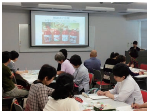
取組報告② 「こどもが主体的に取り組む食育活動」 奈良市立都跡こども園