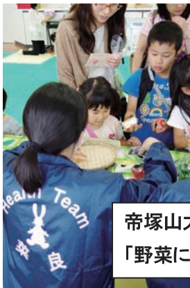
帝塚山大学ヘルsteam 菜良 「野菜について知ろう！」