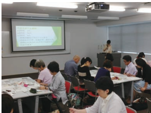
取組報告① 「学生ボランティアによる食育活動」 帝塚山大学ヘルスチーム菜良

保育園・こども園やボランティア団体、飲食店、公民館館長、職能団体など 21 団体、34 名が参加され、活発な情報交換が行われました。