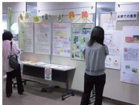
6月は食育月間です。食育実践団体の実践活動の展示も行いました。