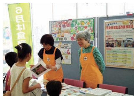
奈良市食生活改善推進員協議会 「食育めり絵、朝食レシピ紹介」