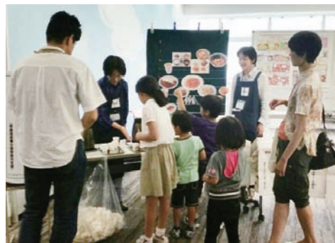
奈良県栄養士会奈良市支部 「健康のために上手に減塩、味噌汁の試飲」