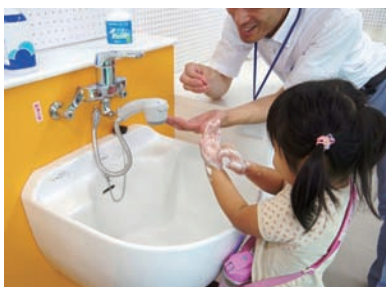
奈良食品衛生協会 「キッズ手洗いチェックコーナー」