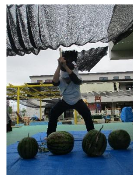
／菅野先生力を貸して!／