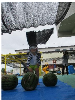
／一番楽しみにしてたかも!／