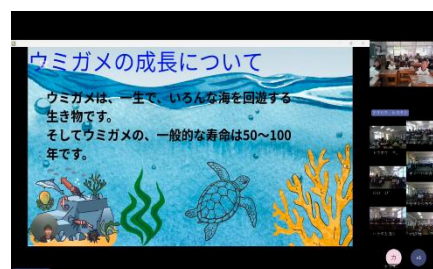
【学校間交流会の様子】

環境省、屋久島森林管理署、屋久島森林生態系保全センター、屋久島環境文化研修センターの方と各校の ESD 担当職員による情報交換会を行っている。