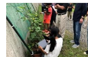
【パッションフルーツの栽培】