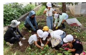
【こきろんぼの収穫】