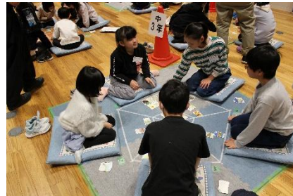
かるた大会の様子