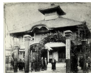
上京 25 番組小学校

本市ではこうした歴史と伝統を誇りに、地域・家庭や社会との連携・協働のもと、子どもたちは先人の叡智と営みを礎に豊かな人生を切り拓き、持続可能でよりよい社会を創造していく主人公であるとの認識の下、市民ぐるみ・地域ぐるみで「一人一人の子どものみを徹底的に大切にする」教育を推進し、今後とも、その歩みをさらに確かなものにしていく。