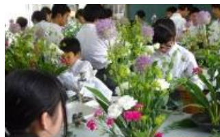
中学生の華道体験