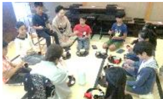
小学生の茶道体験