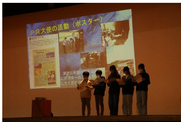
【実践交流発表会の様子】

「いちのへ御所野縄文学の学習活動を互いに発信・交流し合うことにより、今年度の活動の振り返りと今後の活動の意欲付けを図ること」を目的として実施した。学習活動の発表は、各校の6年生が行った。御所野縄文遺跡についての調査探究活動に関する発表、一戸町の特産品を町外、県外に広めるための取組に関する発表、一戸町のまちづくりとして進めたいことを企画書として作成したことに関する発表だった。各校5年生が参加したことにより、各校の取組を次の世代の児童が聞くことにもつながった。また、地域の方にも広く参加を呼びかけたことにより、児童の活動をより多くの方々に知っていただく機会となった。