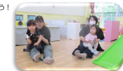
お母さんとふれあい遊び。ふれあうと心がほっとして、あたたかい気持ちになりますね。