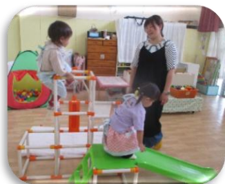
ままごと、絵本、滑り台など、したい遊びを見つけて、楽しんでいます。

今年度の“なかよしひろば”が、5月下旬から始まりました。子どもたちや保護者の方々と一緒に楽しい時間を過ごしていきたいと思っています。どうぞよろしくお願いいたします。