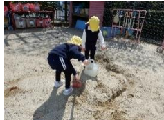
園内の環境を活かし、友達と同じ目的をもってやり遂げ、遊びを創造する楽しさを味わう。