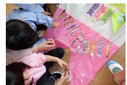
素材の特性や道具を扱う面白さを感じる。