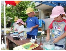
身近な自然物を使って友達と同じイメージをもって遊ぶ。