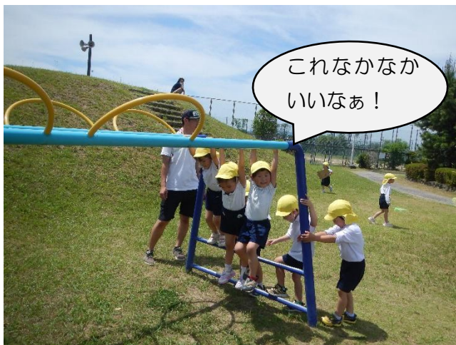
変わった形のうんていに挑戦!