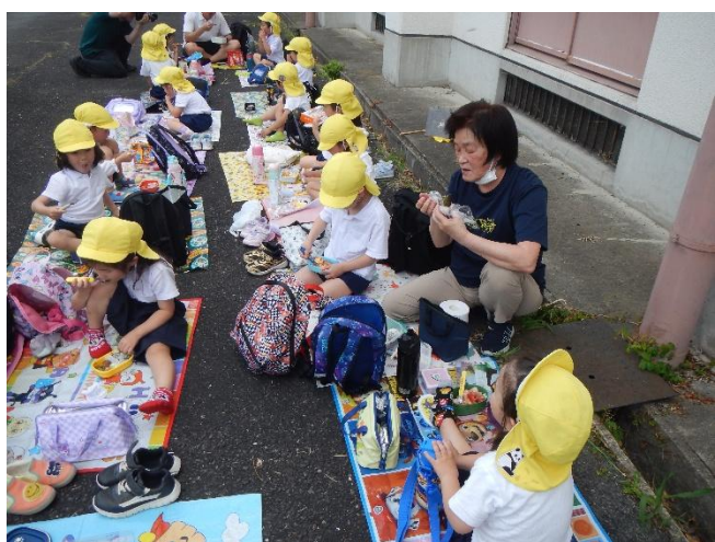
お弁当は日陰にシートを敷いてみんなで食べました♪