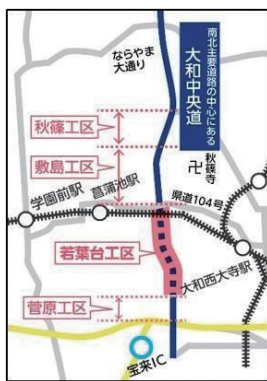
※若葉台工区の整備区間

若葉台工区に関しては、現在事業認可取得に取り組んでいるところであり、取得後は地権者の方々に対して事業への理解や協力を得ていきたい。