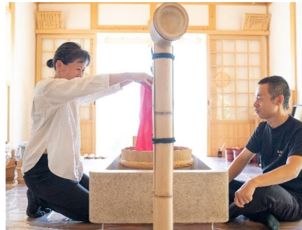
日本でここだけ★700年前から 伝わる染めもの体験