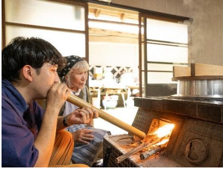
スイカ作り名人のスイカ割りと おくどさんでごはんを炊こう