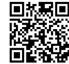
こちらから動画を ご覧いただけます。