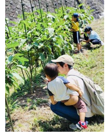
季節の野菜収穫体験&おもしろ 豆知識のお話・ふれあい会