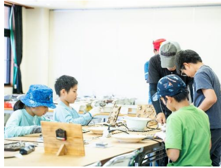
手作り時計工作と秘密基地開拓