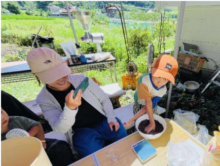
発見がいっぱい！コーヒー博士の 秘密基地とさとやま探検隊