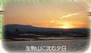
生駒山に沈む夕日