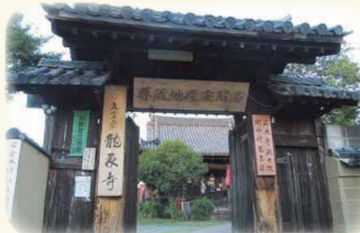
広大寺の龍の伝説が残る、「安産の寺」龍象寺