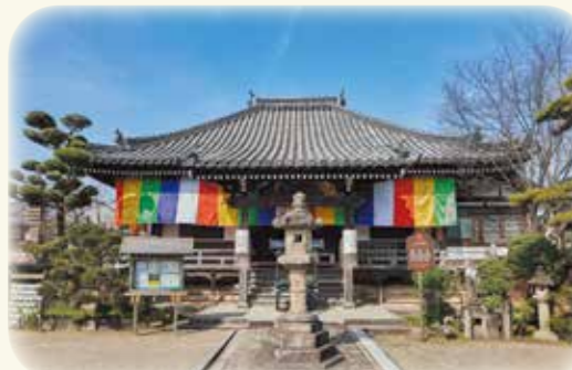
日本最古の安産祈願所 帯解寺