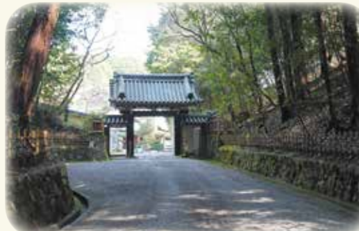
大和三門跡のひとつ 圓照寺 拝観はできませんが、山門までの参道は趣があります