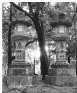
奈良町中から本多奉行のために奉納した燈籠

春日大社の参道には数多くの燈籠が並んでいます。8月は、春日大社万燈籠の季節にちなみ、参道にたつ燈籠の中から、天保9年（1838）に奈良町の人々が、奈良奉行本多淡路守繁親のために奉納した燈籠などを中心に紹介します。