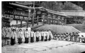
節分真榊奉納 春日神社 林檎の庭

大正15年（1926）から昭和13年（1938）まで、元林院の芸妓衆が仕丁、官女などに扮して、大真榊を積んだ御車を曳いて春日神社に参詣し、真榊奉納後、林檎の庭で神楽を奉納する行事が行われていました。節分の時期にちなみ、絵はがきや新聞でこの行事について紹介します。