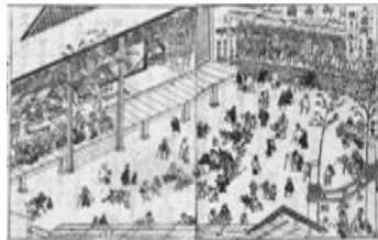
春日大宮若宮御祭礼図 大宿所

おん祭は春日大社の摂社若宮社の祭礼で、保延2年（1136）から続く大祭です。奈良町ではおん祭の主要な行事のひとつ、大宿所祭も行われます。奈良の冬の年中行事、おん祭について、江戸時代の祭礼図などで紹介します。