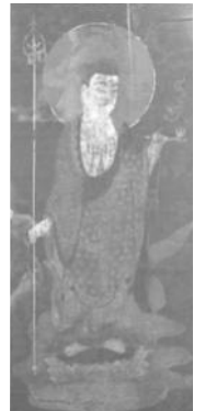
紙本着色地蔵菩薩像

地蔵菩薩は、庶民の身近な信仰の対象として親しまれていて、奈良町でも町内で地蔵尊をまつる町が数多くあります。7月23・24日など、地蔵盆の季節に合わせて、肘塚町町の地蔵講の本尊として祭られてきた地蔵菩薩の絵画、講のときに用いた祭具などを展示、紹介しします。