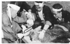
角きり写真カード

中世には「神鹿」として保護を受けていた奈良の鹿ですが、江戸時代になると鹿が人にケガを負わせることなどが問題になりました。そこで寛文12年（1672）から始まったのが鹿の角きりです。毎年10月に行われるこの行事の時期にあわせ、行事の様子を描いた奈良の案内書や角きりの絵はがきなどを展示します。