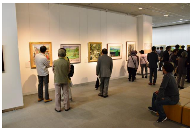
▲前期展示「奈良百景」（4/24～5/6）の様子