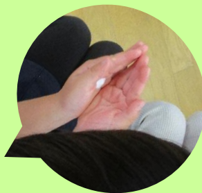
バイ菌が見えるクリーム