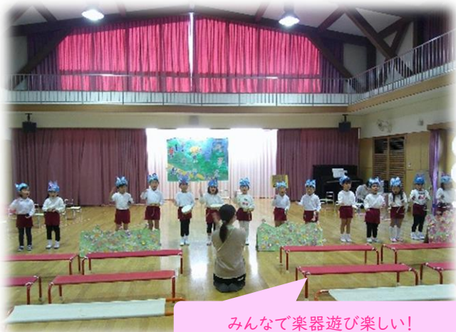
みんなで楽器遊び楽しい!