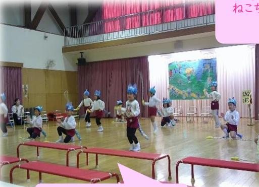
縄跳びダンス しょう