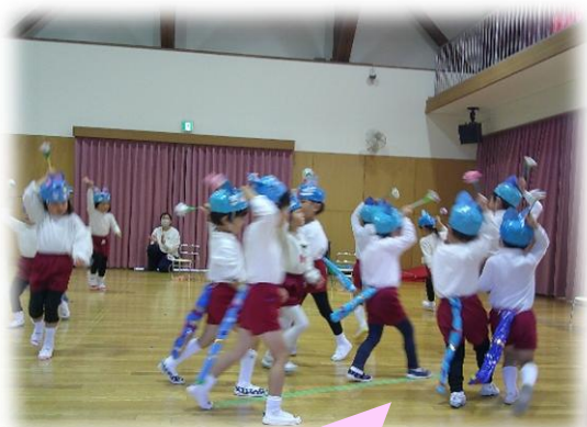
花を頭につけてスキップ〜♪