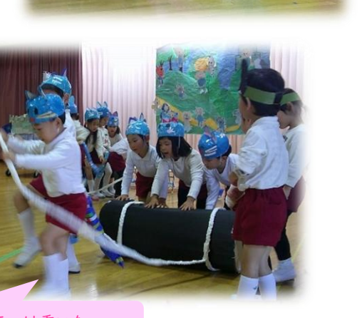
ローラーは重いなあ…