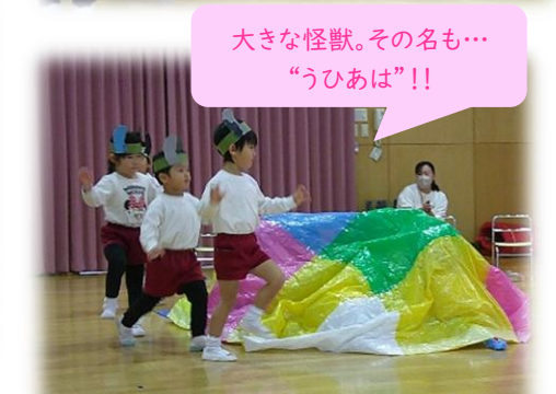
大きな怪獣。その名も… “うひあは”!!