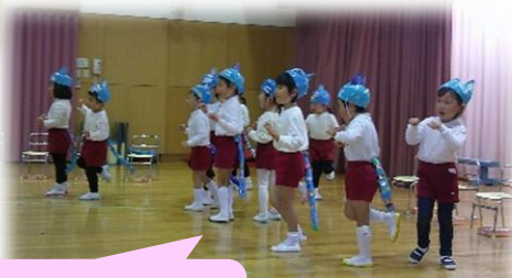
ねこちゃんになってポーズ! ニャ〜☆