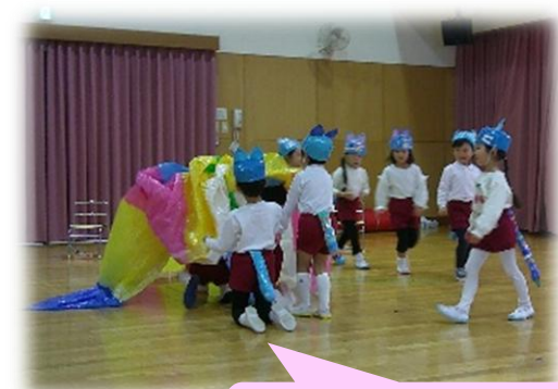
『ふくろにはいるな』の立て札が あったけど…