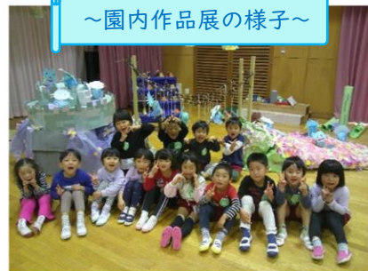
～園内作品展の様子～

“ねこ”、“とらねこたいしょう”、“うひあは”の中から、自分のしたい役になりきって、動きや場面にあった言葉を自分たちなりに考えて表現しています。