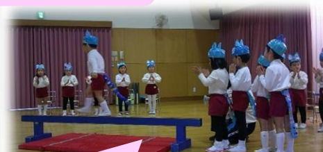
昨年よりも高くくて幅の狭い橋だけど へっちゃらだよ