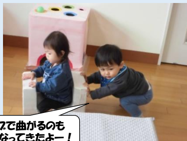
カーブで曲がるのも 上手になってきたよー！