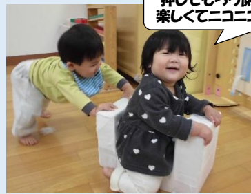
押してもらう側も 楽しくてニユニコ♡

写真からも分かるように、少しずつですが 友達との関わりが見られるようになってきました♪