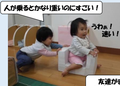
人が乗るとかなり重いのにすごい！