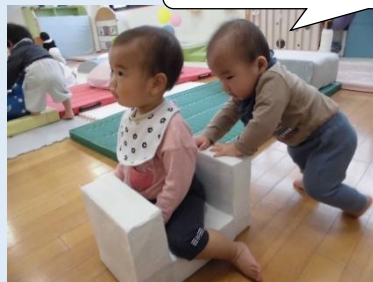
友達がまたかると、 すぐ押しに向かいます♪