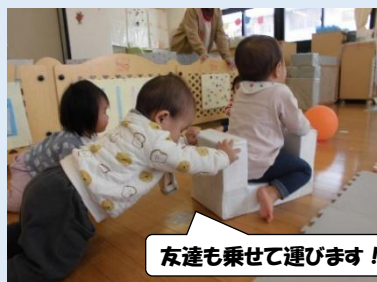
友達も乗せて運びます！