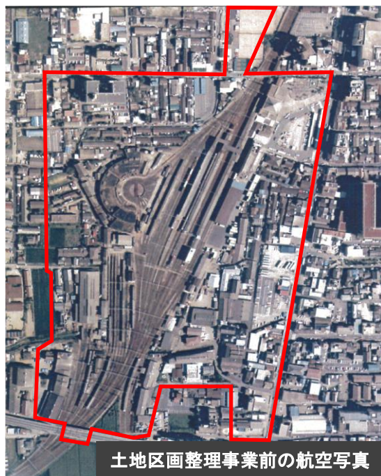
土地区画整理事業前の航空写真