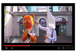
東京都港区 鉄道発祥の地からツアースタート! 旧新橋停車場 鉄道歴史展示室