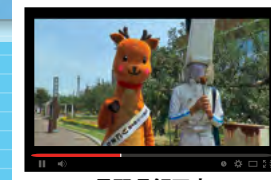
長野県飯田市 名所、りんご並木を仲良くお散歩