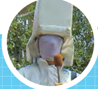
リニア招き鹿:リにまね 奈良市リニアファン倶楽部部員 リニー君