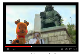
山梨県甲府市 武田信玄公にリニア誘致の必勝祈願