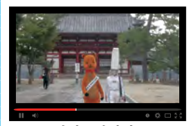
奈良県奈良市 東大寺、奈良町、若草山夜景... 奈良の魅力を徹底取材!