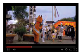
岐阜県中津川市 奇祭「なめくじ祭り」に潜入!