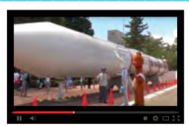
神奈川県相模原市 リニー君、宇宙へ? JAXA相模原キャンパスを訪問