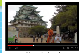
愛知県名古屋市 2027年東京・名古屋間開業の地を ついに走破!