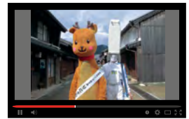
三重県亀山市 駅候補地、亀山市で関宿をぶらり旅