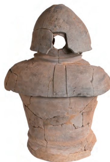
南新コモ川古墳出土甲冑形埴輪